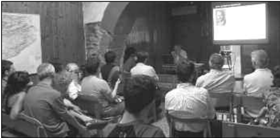
Les nuclears no són alternativa per aturar el canvi climàtic.

I per si això no fos poc, genera uns residus que triguen 200.000 anys a deixar de ser perillosos. Però el