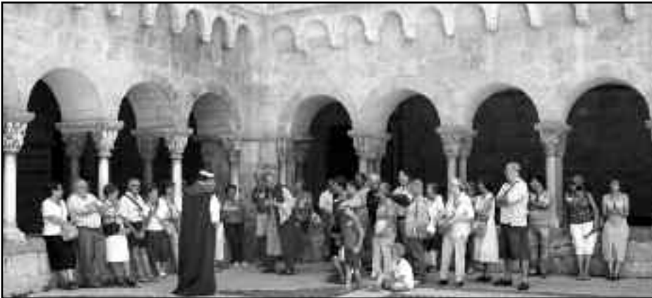
Visita teatralitzada al claustre del Monestir de Sant Cugat.

noses de l'església oficial al llarg de tota la seva història gràcies a la complicitat d'una institució tant penosa com era la "Santa Inquisició". La participació en aquest cicle tindrà un incentiu, i és que en acabar el trimestre "setembre octubre i novembre", farem lliurament d'un record commemoratiu del tema que ens ocuparà, als assistents a les tres sortides com a premi de fidelitat . Us hi esperem. Tindrem un sostre de participació de 40 places a la primera sortida, que serà al Castell de Gardeny i la Seu de Lleida, el dia 20 de setembre; serà Miravet i el seu famós castell, el dia 25 d'octubre. I la darrera serà a Castelló d'Empúries, la darrera Comanda Templera del nostre recorregut per aquest món històric, conseqüència de les croades, aquella aventura incontrolada