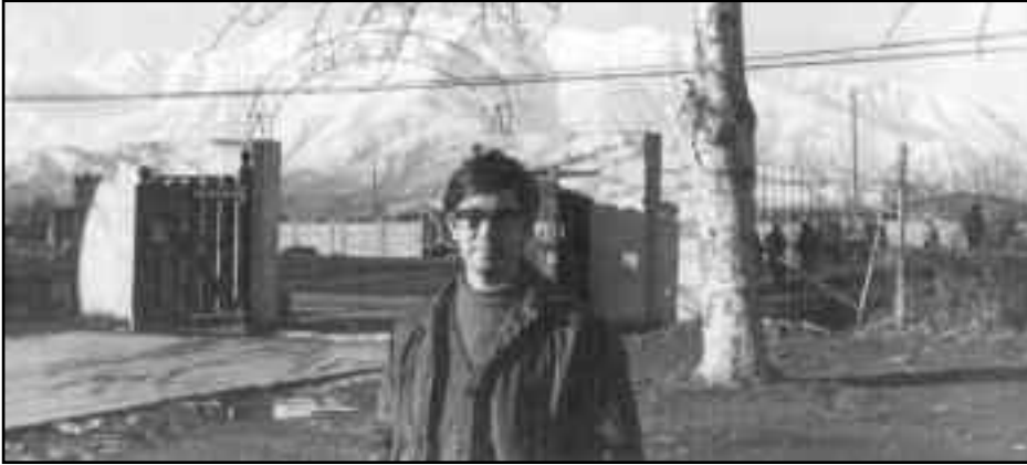
Serralada nevada davant l'Escola Industrial Las Nieves. Xile, 1971.

pena veure les grans possibilitats que té aquest petit instrument. Penseu que per preparar una sorti-