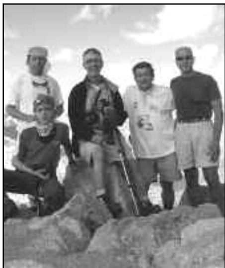
Carros de Foc 2004.