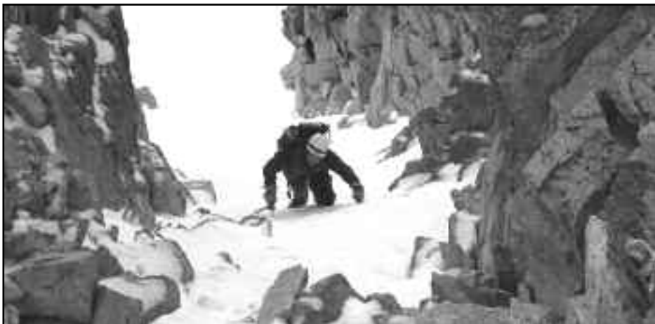
Variant Petit Black.

Un cop a la base del corredor, una mica de líquid, unes galetes per