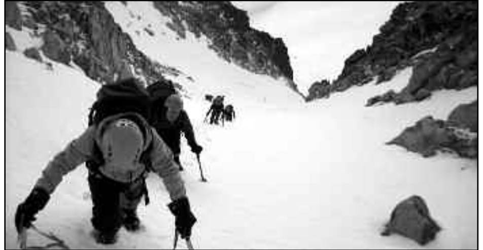
Rampes del corredor Estasen.

A les 16:00 hores ja teníem el campament muntat i tots dintre de les respectives tendes a descansar. Va