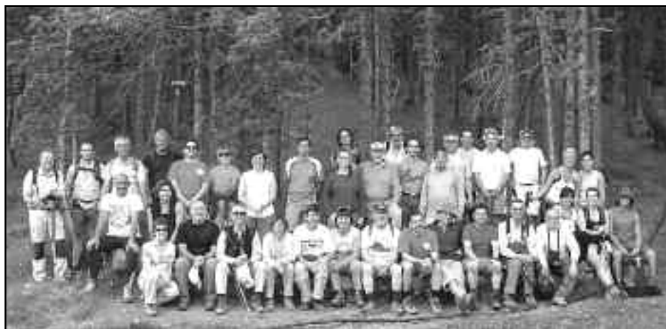
Foto de grup vora el refugi Lluís Estasen.