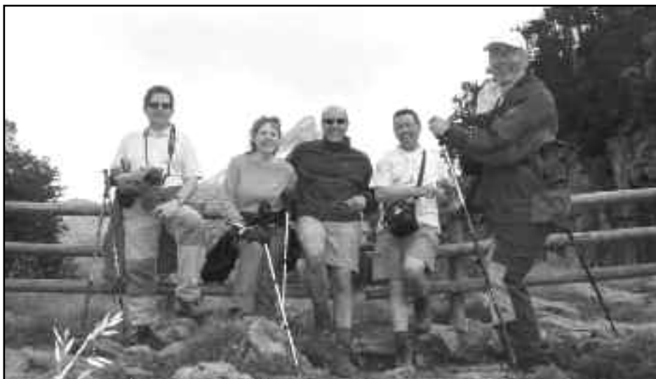
Preparació de senderisme: Queralps-Planoles.

Totes aquestes aficions han nascut a l'escola No voldríem passar per alt dues grans aficions teves: l'edició de vídeo i la georeferenciació de muntanya, popularment coneguda com a "GPS". Per quina raó t'interessen tant?