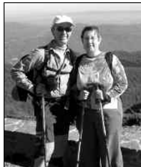
Tardor al Montseny ben acompanyat.