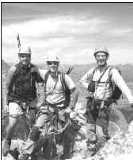
Primera ferrada: Bony d'Envalira 2007.

M'agradaria ajudar a descobrir als joves les grans possibilitats que