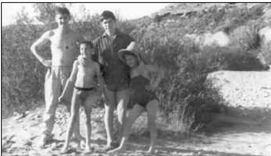
Amb 15 anys en companyia dels germans al riu del poble.

Als 14 anys vaig fer un gran canvi. Això em va fer prendre la decisió d'estudiar magisteri.