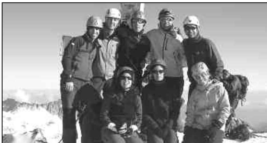
Tot el grup al cim de l'Aneto (3.404 m).

Gràcies a tots per haver compartit aquest cim tant especial per a mi.