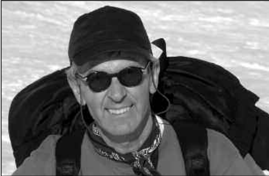
El nostre protagonista al Puigmal, l'abril del 2004.

Realment l'esforç va valer la pena, ja que vam tenir molt bona acceptació.