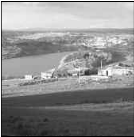
El paisatge que enganxa.

Xops només sortir com aquell que diu, varem continuar pujant fins arri-