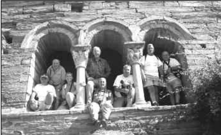
Claustre exterior del Priorat de Serrabona.

Conclusió: com en el cas de l'equip de futbol sala del CEM, hem suat la samarreta groga, llampant, de la MM i no ha reeixit el triomf, però