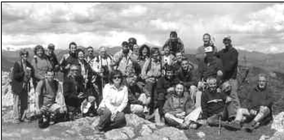
Foto de grup al Santuari de la Mare de Déu del Mont.

Ara no sé si això que acabo d'explicar també ho he somiat.