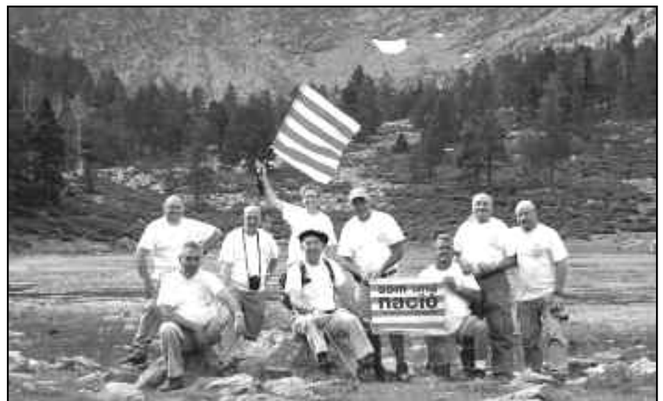
Tot i la retirada assenyada, celebració del grup.

decisió més difícil per assimilar en 9 receptors diferents: ens dividim