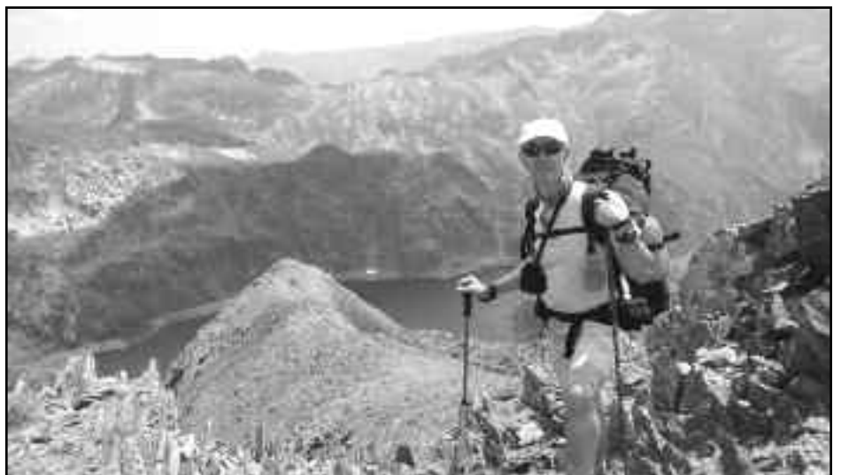
Porta del Cel 2006.

Cada vegada és més fàcil i assequible aconseguir-ne un i val la