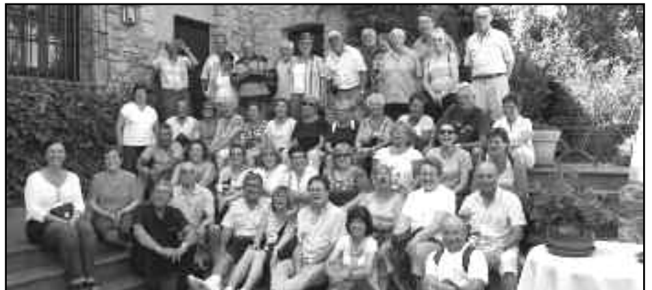
El grup a Peratallada.

d'una època gloriosa, engegada amb gran esplendor, van acabar,