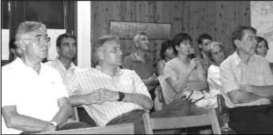
Molta gent no es va voler perdre la conferència.

Durant el col·loqui, el senyor Lloret ens va explicar altres "perles" com el finançament de l'AVE gràcies a la venda d'àrids extrets amb nocturnitat i traïdoria de la llera del riu Llobregat, o la desviació de la riera de Rubí directament al canal de la Infanta perquè, malgrat haver passat per dues depura-