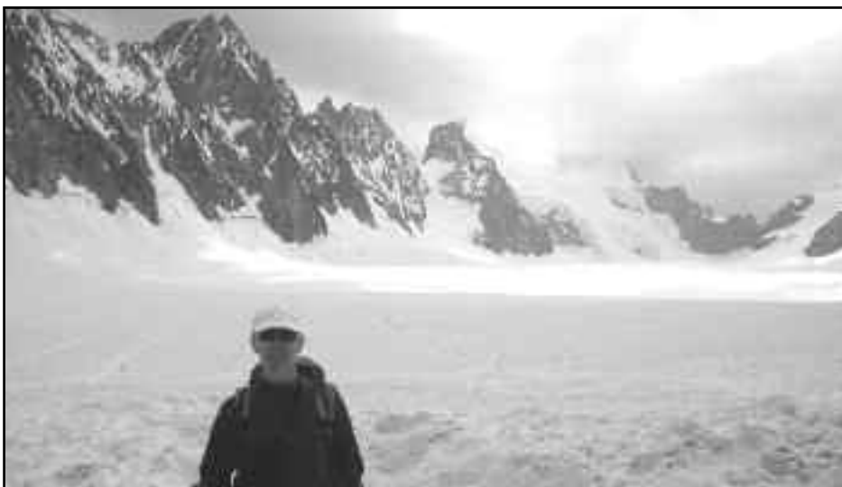
Alps francesos (4000 m) al 2008.

Sempre trobem alumnes que accepten l'aventura d'aprendre. Els alumnes que saben treballar et deixen i et poden ajudar molt.