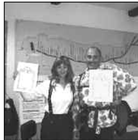
Amb les proves del "delicte".

cia de les imatges dels sants, de Déu Nostre Senyor allà, els grans records i experiències viscudes en aquells deu dies, el retrobament amb altres pelegrins amb qui ens varem trobar al llarg del camí, ens omplia d'emoció els ulls, la gola i el cor.